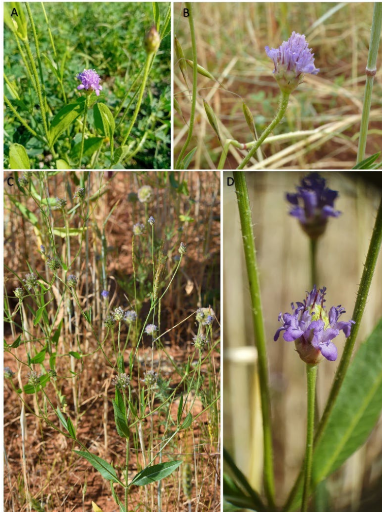
Planche 1. Inflorescence et port de Cephalaria syriaca ; A - E. Cadet, Saint-Laurent-de-la-Prée, 16/06/2025, CC-BY-NC-ND ; B - H. Michaud, Signes (83), 20/06/2024, CC-BY-NC-ND ; C - O. Jonquet, Signes (83), 24/06/2025, CC-BY-NC-ND ; D - L. Dixon, Signes (83), 24/06/2025, CC-BY-NC-ND.