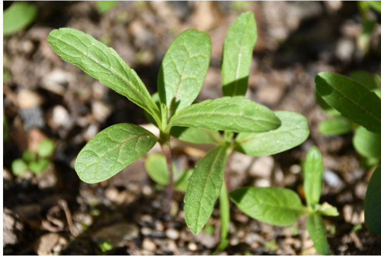
Photo 1. Plantule de Cephalaria syriaca le 29/11/2025, un mois après le semis à partir de fruits récoltés à Saint-Laurent-de-la-Prée ; G. Fried, CC-BY-NC-ND.