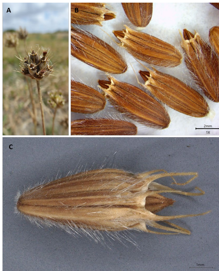
Planche 2. Infrutescence et akènes de Cephalaria syriaca ; A - B. Besse, Saint-Laurent-de-la-Prée (17), 15/07/2025, CC-BY-NC-ND ; B - à partir de prélèvements réalisés sur la station varoise, commune de Signes (83), L. Dixon, CC-BY-NC-ND ; C - à partir de prélèvements réalisés sur la station de Saint-Laurent-de-la-Prée (17), S. Bastin, CC-BY-NC-ND.

Traditionnellement, deux formes étaient distinguées : f. pedunculata DC. aux capitules longuement pédonculés et f. sessilis DC. aux capitules sessiles (Rouy & Foucaud, 1893-1913). Verlaque (1980) précise toutefois que ces formes n'ont pas de réelle valeur systématique, étant trouvées en mélange dans les mêmes populations. Plus tard, les travaux de Bobrov (1928-1929) et de Szabó (1940) ont proposé une subdivision en cinq sous-espèces, principalement différenciées par les caractères morphologiques de leurs fruits. Ce sont les suivantes : subsp. syriaca , subsp. phoeniciaca Bobrov, subsp. transcaucasica Bobrov, subsp. turanica Bobrov et subsp. emigrans Szabó (Verlaque, 1980). Selon cette conception, les populations introduites en France appartiendraient à la sous-espèce emigrans (Tison & de Foucault, 2014), également observée en Espagne, en Italie, en Sicile, dans les Balkans, en Asie mineure et au Kurdistan. Ce découpage est toutefois controversé et il n'est aujourd'hui plus reconnu par les spécialistes du genre (Ghazanfar & Edmondson, 2013 ; Göktürk & Sümbül, 2014).