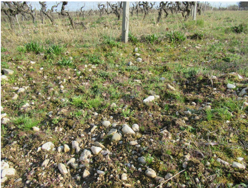
Photo 2. Le Miboro minima – Molinerielletum minutae à Fronton (Haute-Garonne), Le 10 mars 2022 ; NeO/M. Menand, CC-BY-NC-ND.

Intérêt patrimonial : le Miboro minima – Molinerielletum minutae est une association végétale endémique d'un tout petit territoire du Bassin aquitain. Elle héberge l'un des rares foyers français de la Poaceae Molineriella minuta , protégée en France et classée vulnérable dans la liste rouge UICN de Midi-Pyrénées.