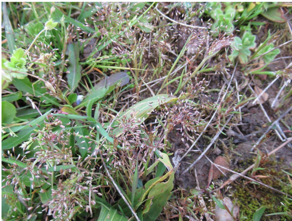
Photo 1. Molineriella minuta à Fronton (Haute-Garonne), le 10 mars 2022 ; NeO/M. Menand, CC-BY-NC-ND.

The Miboro minimae - Molinerielletum minutae is described as a new therophytic plant association, endemic to the quaternary sandy alluvium of the Tarn between Toulouse and Montauban (Occitanie). It colonizes the edges of cultivated vineyards in early spring. It shows a certain variability along a trophic gradient, necessitating the creation of a more oligotrophic sub-association tuberarietosum guttatae . The floristic composition of the association places it at the limit of the therophytic classes of Cardaminetea hirsutae Géhu 1999 (eutrophilous) and Tuberarietea guttatae (Braun-Blanq. ex Rivas Goday 1958) Rivas Mart. 1978 (oligo-acidophilous).