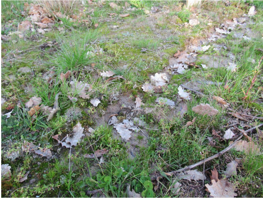
Photo 3. Le Miboro minima – Molinerielletum minutae à Vacquiers (Haute-Garonne), Le 23 mars 2022 ; NeO/M. Menand, CC-BY-NC-ND.