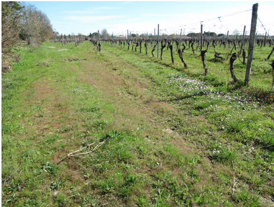
Photo 4. Bord de parcelle riche en Molineriella (plages rougeâtres) à Fronton, Le 19 mars 2024 ; NeO/M. Menand, CC-BY-NC-ND.