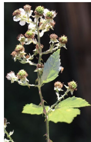
Planche 1. Rubus arrigens Sudre, primocanne, feuille de la primocanne, fleur et floricanne, Cuxac Cabardès (Aude) ; L. Belhacène, CC-BY-NC-ND .