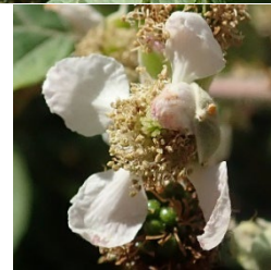
Planche 3. Rubus winteri P.J. Müll. ex Focke ; L. Belhacène, CC-BY-NC-ND.