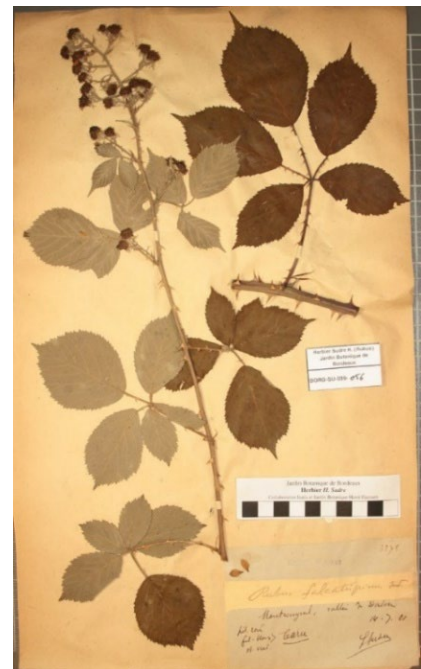
Photo 3. BORD-SU-039-056, holotype de Rubus falcatispinus Sudre ex L. Belhacène.

Un nom valide et légitime est donné ici à Rubus falcatispinus tel que conçu par Sudre pour ces plantes du Tarn, qui ne correspond pas à R. pubescens Weihe ex Boenn. taxon