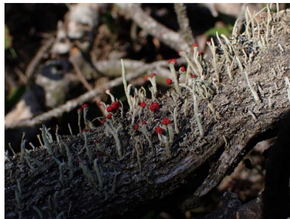
Photo 2. Cladonia macilenta ch. macilenta