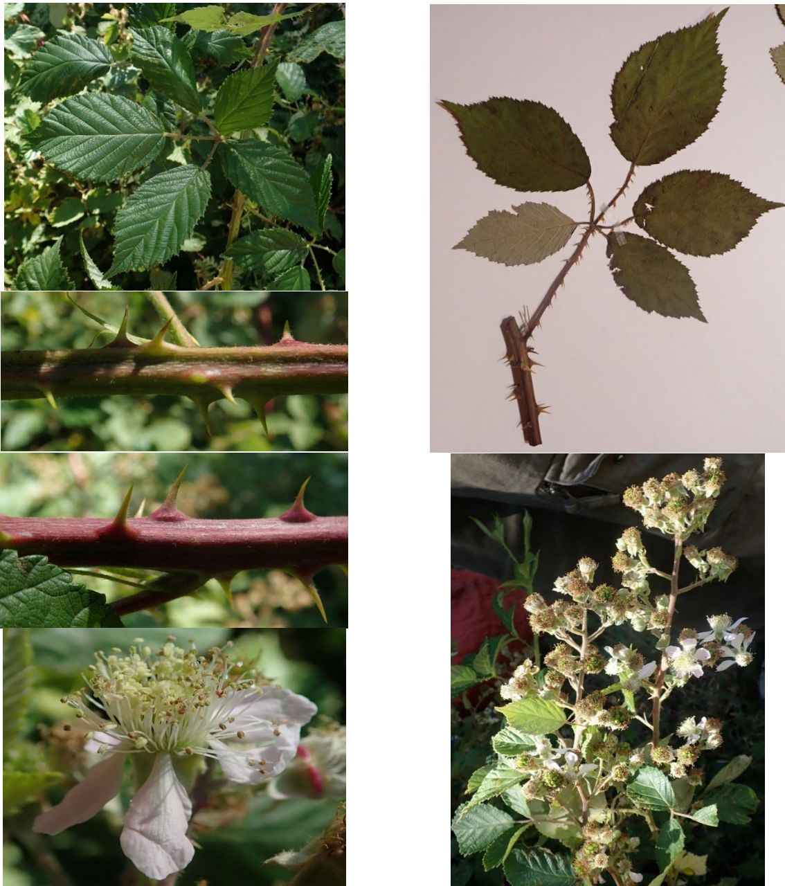
Planche 2. Rubus falcatispinus Sudre ex L. Belhacène (plantes de Cassagnoles) ; L. Belhacène, CC-BY-NC-ND .

falcatispinus Sudre ( Bull. Acad. Int. Géogr. Bot. 15 : 134, 1905), ce dernier étant un synonyme homotypique de Rubus rostratus Boulay & Foucaud in Boulay.