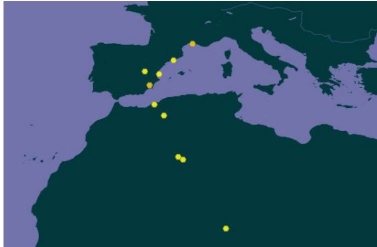
Carte 1. Répartition connue de Riella cossoniana en Europe et Afrique ; GBIF Secretariat (2023), CC-BY-NC-ND.

Riella cossoniana Trab. est un taxon de répartition notamment méditerranéenne et nord-africaine (Ros et al. , 2007 ; GBIF Secretariat, 2023 ; carte 1). D'autres stations non répertoriées par le GBIF (GBIF Secretariat, 2023) sont signalées en Asie (Corbière, 1902 ; Patel, 1977 ; Söderström et al. , 2002).