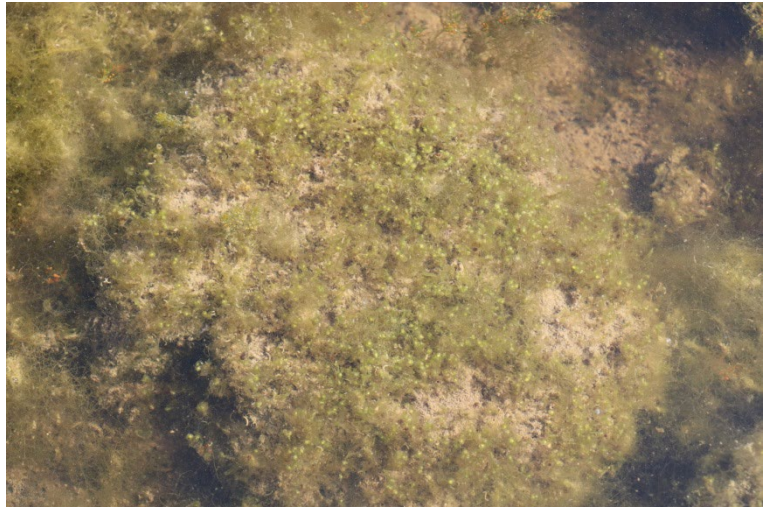
Photo 4. Aspect immergé de Riella cossoniana (domaine du Canavérier, le 28/05/2018) ; J.-B. Mouronval, CC-BY-NC-ND .