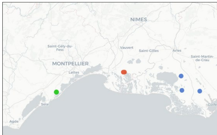
Carte 2. Stations de Riella cossoniana inventoriées en France ; en bleu les stations est-camarguaises, en rouge celles du Canavérier, en vert les Salines de Villeneuve-lès-Maguelone

Avec actuellement moins de vingt stations connues, l'espèce paraît relativement rare en Europe.