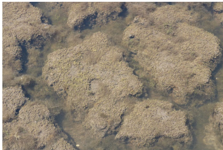
Photo 5. Première station de Riella cossoniana découverte au domaine du Canavérier, le 28/05/2018 ; à noter le substrat divisé en polygones de dessiccation ; J.-B. Mouronval, CC-BY-NC-ND .