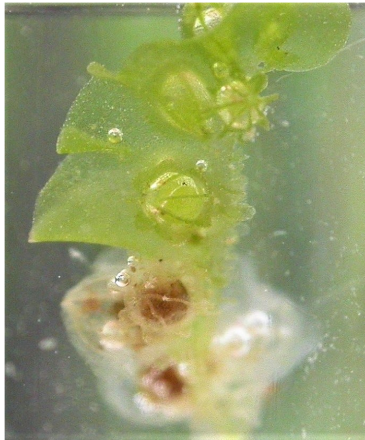
Photo 1. Aspect immergé de Riella cossoniana ; le thalle fait à peine 2 cm de hauteur, mais l'involucre femelle anguleux ailé est déjà bien visible ; B. Offerhaus, CBNMed, CC-BY-NC-ND .

Riella cossoniana Trab. has recently been found in two sites in the Occitanie region, owned by the Conservatoire du littoral: the "domaine du Canavérier" (Gard) and the "Salines de Villeneuve" (Hérault). The inventoried stations are described and their hydrologic functioning is detailed.