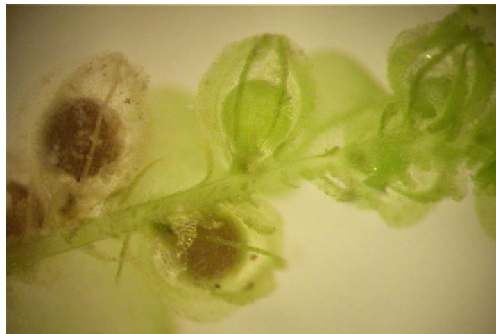
Photo 9. Riella cossoniana, sporophytes femelles