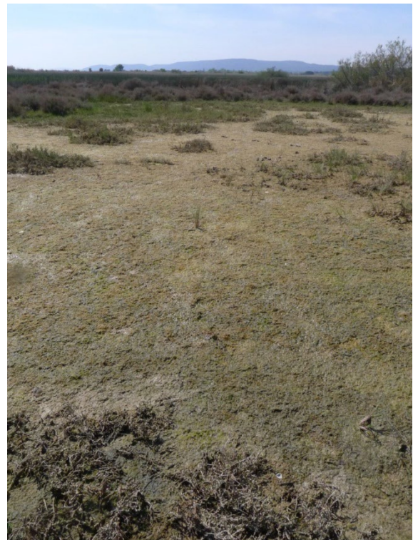
Photo 7. Station 2 de Riella cossoniana aux Salines de Villeneuve-lès-Maguelone, le 7 avril 2020 ; l'espèce finit son cycle sous forme de tapis verdâtres sur la vase encore humide ; M. Kleszczewski, CC-BY-NC-ND.