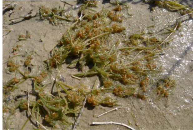
Photo 8. Tolypella hispanica est une espèce compagne fréquente de Riella cossoniana (Salines de Villeneuve-lès-Maguelone, le 19 mars 2020) ; les deux espèces ont un développement particulièrement précoce ; M. Kleszczewski, CC-BY-NC-ND .

Dans ce contexte, la mise en place d'un suivi annuel des populations, entre les mois de mars et mai selon les sites, paraît essentielle pour la détection immédiate de changements significatifs des conditions stationnelles pour Riella cossoniana .