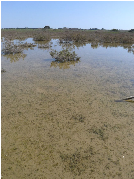
Photo 6. Station 1 de Riella cossoniana lors de sa découverte le 19 mars 2020 aux Salines de Villeneuve-lès-Maguelone ; les taches vertes formées par l'espèce sont relativement discrètes ; M. Kleszczewski, CC-BY-NC-ND.

À noter par ailleurs l'absence dans cette pièce d'eau d' Althenia filiformis pourtant très abondante dans les lagunes des Salines de Villeneuve-lès-Maguelone (Paradis, 2020). On pourrait supposer que le fonctionnement hydraulique de la lagune à Riella cossoniana est trop intermittent pour Althenia puisque cette pièce d'eau subit un assec estival très marqué. Ainsi, en 2020, année a priori très favorable au développement de Riella cossoniana dans le site, la pièce d'eau avait déjà séché début avril. Les lagunes à Althenia , quant à elles, étaient encore en eau jusqu'au mois de juillet. Il reste à souligner que cette lagune temporaire ne s'inonde pas tous les ans. Les Riella doivent alors subsister sous forme de diaspores résistant à la dessiccation, en attente d'une année avec mise en eau automnale favorable.