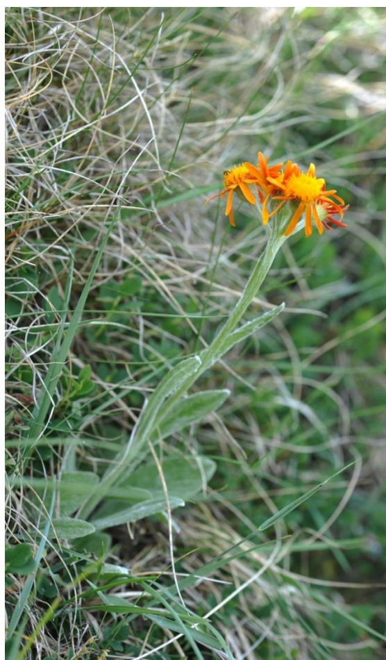
Tephroseris integrifolia subsp. capitata : Pic Sarrouyes