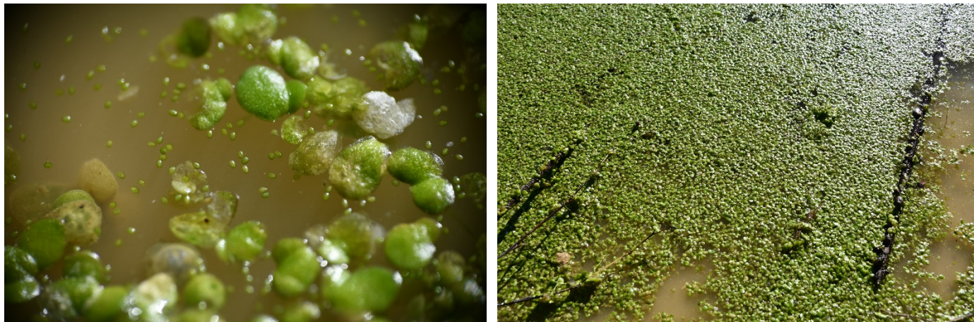
Photo 4. Aspect du Lemnion minoris avec Lemna gibba et Wolffia globosa , en fin d'hiver (17/02/2021).

en région méditerranéenne française. Par ailleurs, l'espèce semble avoir passé plusieurs hivers en climat continental en Allemagne, même s'il faut noter que les derniers hivers ont été relativement plus cléments (Frank et al. , 2020). Beigel (2020) note par exemple que des frondes de W. globosa avaient survécu sous une couche de glace durant un épisode de froid en janvier 2019. Nous avons de même pu continuer à observer la plante en décembre 2020 et en février 2021 après plusieurs périodes de gelée. Bien qu'en densité moins importante et sans frondes filles à cette période, de nombreuses frondes étaient toujours présentes au sein du tapis de Lemna gibba (photo 4).