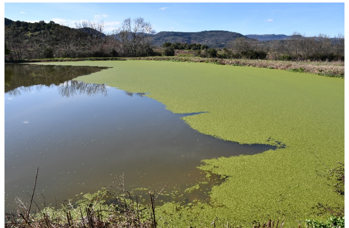
Photo 1. Bassins d'épuration à Lemna gibba et Wolffia globosa (voile du Lemnion minoris ) sur la commune de Clermont-l'Hérault, le 28/10/2020 (à gauche) et du Puech, le 17/02/2021 (à droite).

La seule espèce du genre Wolffia présente dans l'Hérault était à ce jour Wolffia arrhiza (L.) Horkel ex Wimm. Cependant la lentille du Salagou n'avait ni la forme caractéristique de W. arrhiza , qui a la face supérieure aplatie, ni sa couleur vert foncé. Nous avons alors pensé à W. columbiana H. Karst., espèce exotique qui venait d'être découverte dans la métropole lilloise (Lecron, 2021) et dont la face supérieure verte transparente et plus ou moins arrondie correspondait bien à notre lentille. Pour confirmer cette piste, nous avons réalisé un montage au microscope. Avec au maximum 4-5(6) stomates par fronde, nous avons pu définitivement écarter W. arrhiza qui possède généralement 10 à 100 stomates par fronde (Flora of North America Editorial Committee, 1993 ; Armstrong, 2017). Cependant la taille de nos lentilles variait beaucoup, d'environ 0,5 à plus de 1 mm, notamment en prenant en compte l'ensemble de la lentille,