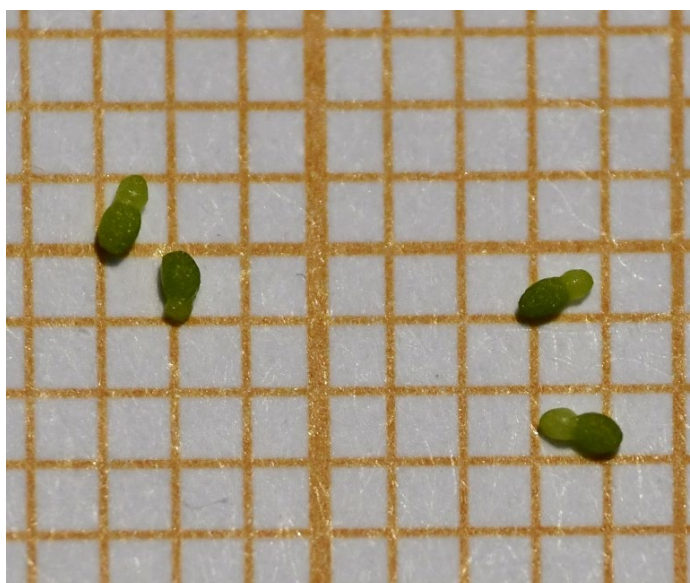
Photo 2. a) W. globosa en compagnie de Lemna gibba in situ ; b) W. globosa avec fronde mère et fronde fille bien visibles sur fond de papier millimétré.