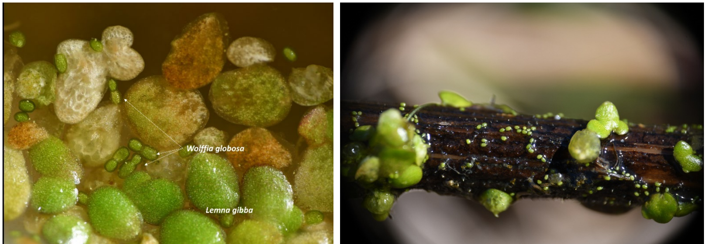
Photo 3. a) W. globosa en compagnie de Lemna gibba in situ et b) sur une tige sèche.

Wolffia globosa (Roxb.) Hartog & Plas ( Blumea 18 : 367, 1970 ; basionyme : Lemna globosa Roxb., Fl. Ind. ed. 1832, 3 : 565, 1832) possède une fronde de forme ovoïde ou ellipsoïde-cylindrique (plus longue que large), verte transparente sur toute sa surface (N.B. : certaines populations peuvent inclure des individus avec une surface dorsale d'un vert plus foncé), convexe sur la face supérieure avec la partie centrale supérieure aplatie, avec la plus grande largeur nettement sous la surface de l'eau ( i.e. seule la partie centrale de la surface dorsale est au-dessus de l'eau). Les dimensions de la fronde ( i.e. de la fronde mère sans la fronde fille) est 0,4-0,8(0,9) mm de long, et de 0,3-0,5 mm de large, ce qui en fait la plus petite de toutes les plantes à fleurs connues ! La fronde est 1,3-1,7(2) fois aussi longue que large et 1-1,5 fois aussi profonde que large. Le nombre de stomates varie de 8 à 25 (plus rarement jusqu'à 35 stomates), ils sont difficiles à observer, plutôt pâles et d'un vert quelque peu transparent en surface. La fronde ne possède ni veines ni cellules pigmentaires épidermiques brunes. 2n = 30, 60 .