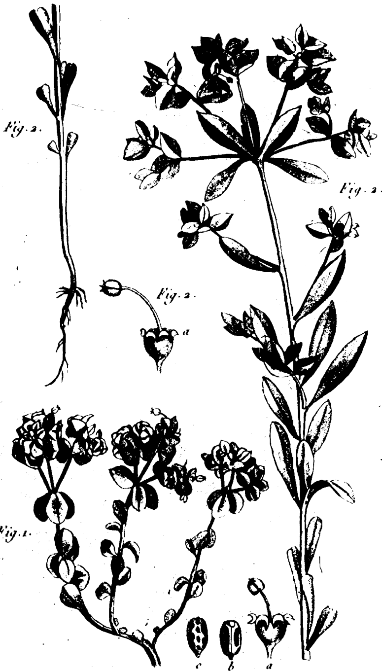
Fig. 1 EUPHORBIA rotundifolia. F. 2 EUPHORBIA obtusa. L.