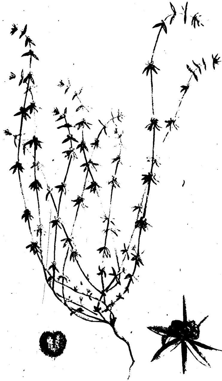
GALIUM verticillatum Benth.