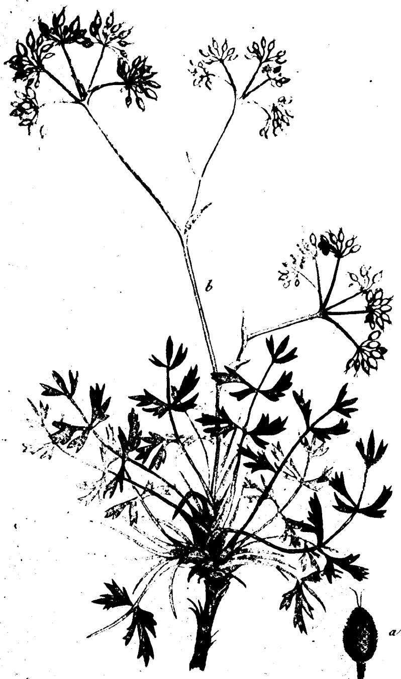
PIMPINELLA canescens . Linn.