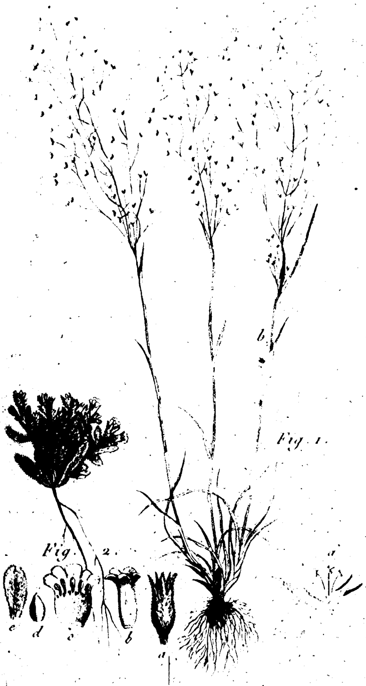
Fig. 1. AGROSTIS Elegans. Fig. 2. MYOSOTIS Picilla L. Theriac. med.