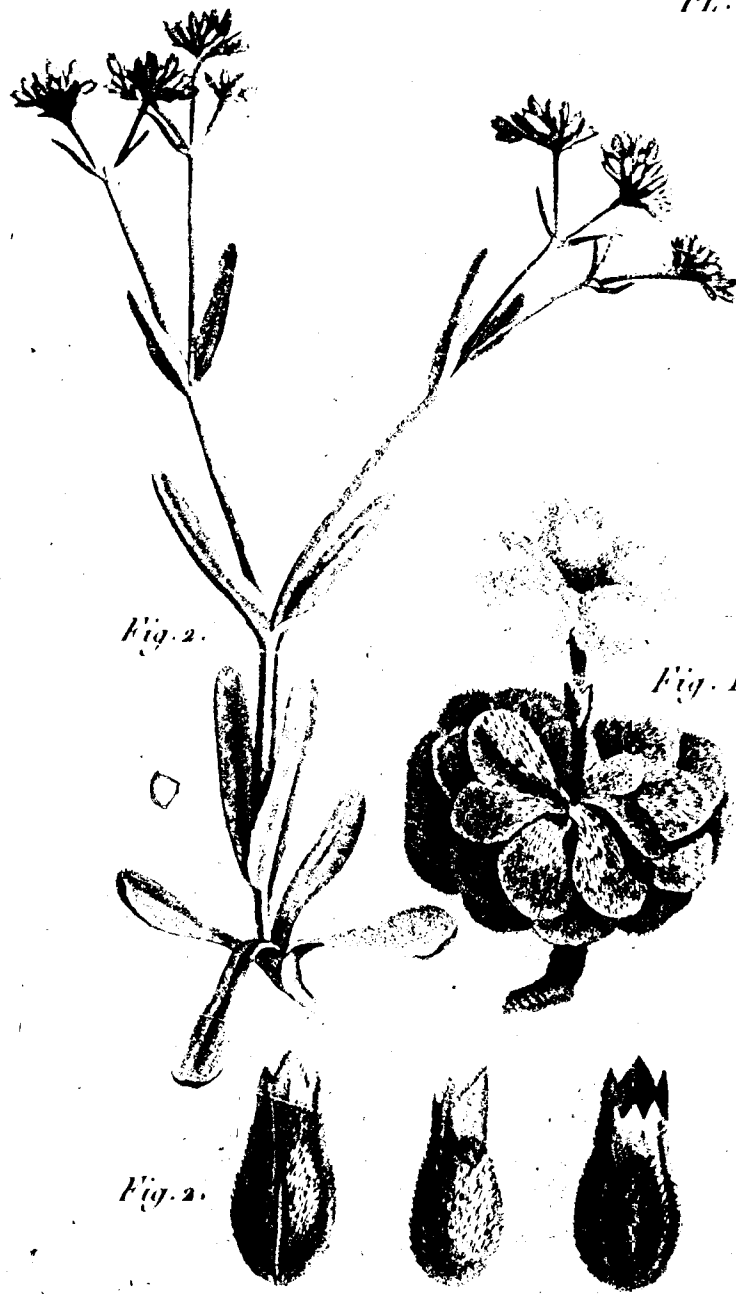
Fig. 1 PRIMULA Allionii. F. 2 VALERIANELLA Ericoperula. Lois. Desv.