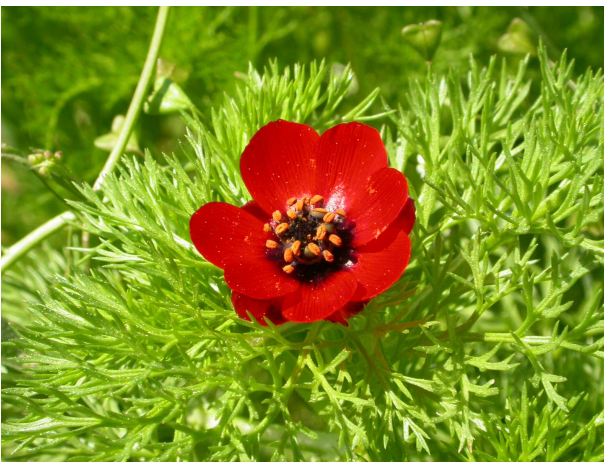
← Adonis annua L. (5)