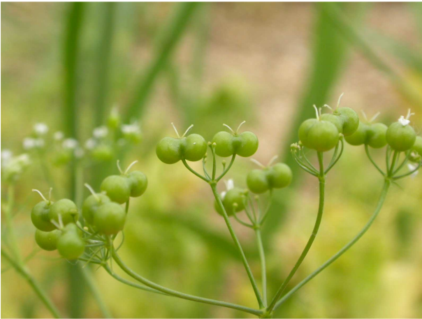
↑ Bifora radians M.Bieb. (1)