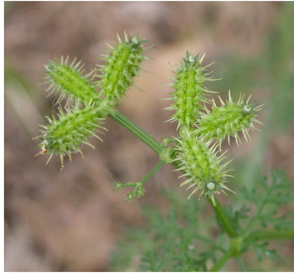
(2) Caucalis platycarpos L. →