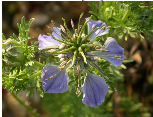
(4) Nigella gallica Jord. ↓