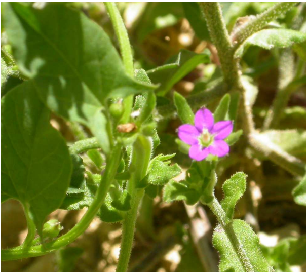
← Legousia hybrida (L.) Delarbre (3)