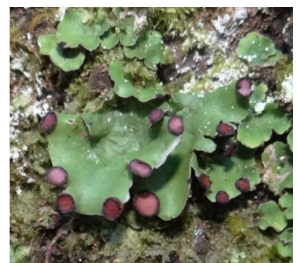
Peltigera venosa (L.) Hoffm., Gouaux-de-Luchon le 09/05/2014