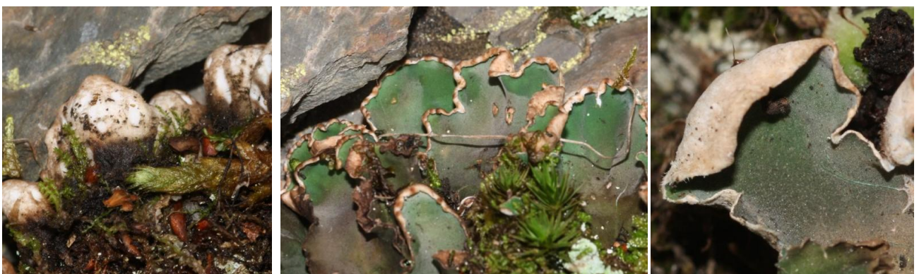
Peltigera malacea (Ach.) Funck, Oô le 06/07/2014