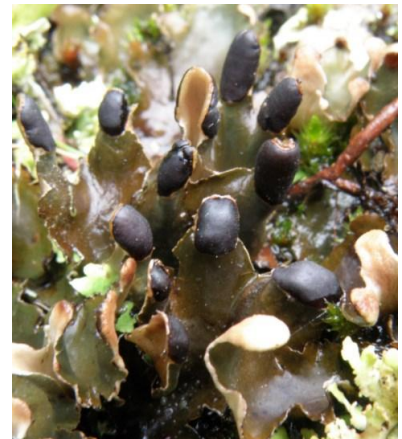
Peltigera neckeri Hepp ex Müll. Arg., Limousis (Aude) et Vaudreuille le 10/05/2013