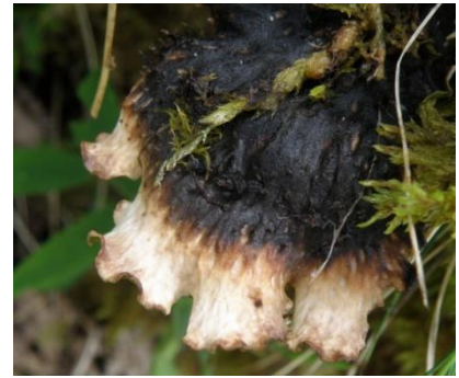
Peltigera aphthosa (L.) Willd. Oô le 06/07/2014