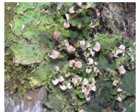
Peltigera leucophlebia (Nyl.) Gyeln., Baren le 17/02/2014