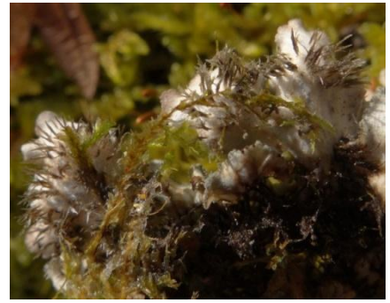
Peltigera collina (Ach.) Schrad., Boutx et Aspet les 04/01/2013 et 30/12/2013