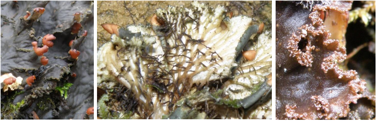
Peltigera praetextata (Flörke ex Sommerf.), Montbrun-Lauragais le 03/01/2013