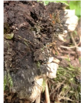
Peltigera britannica (Gyeln.) Holt.-Hartw. et Tønsberg, Montauban-de-Luchon le 04/06/2014