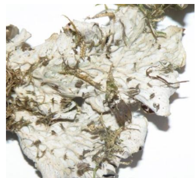
Peltigera hymenina (Ach.) Delise, Portet d'Aspet le 22/04/2013