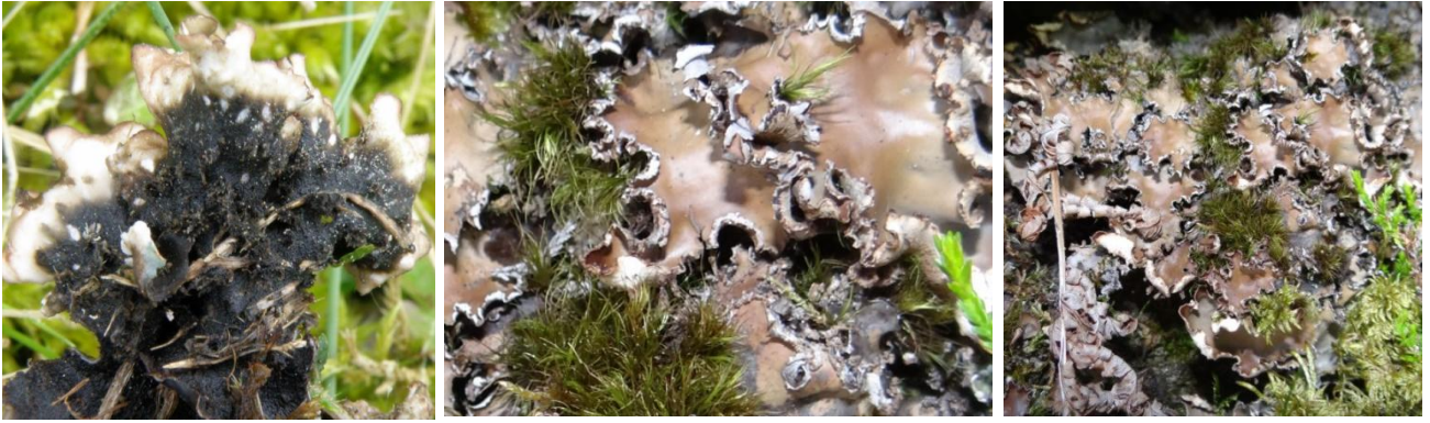
Peltigera elisabethae Gyeln., Gouaux-de-Luchon le 05/07/2014