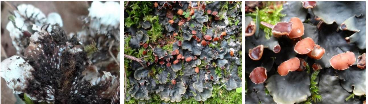
Peltigera horizontalis (Huds.) Baumg., Melles le 24/06/2014