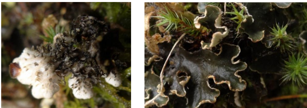
Peltigera rufescens (Weiss) Humb., Revel le 27/05/2014