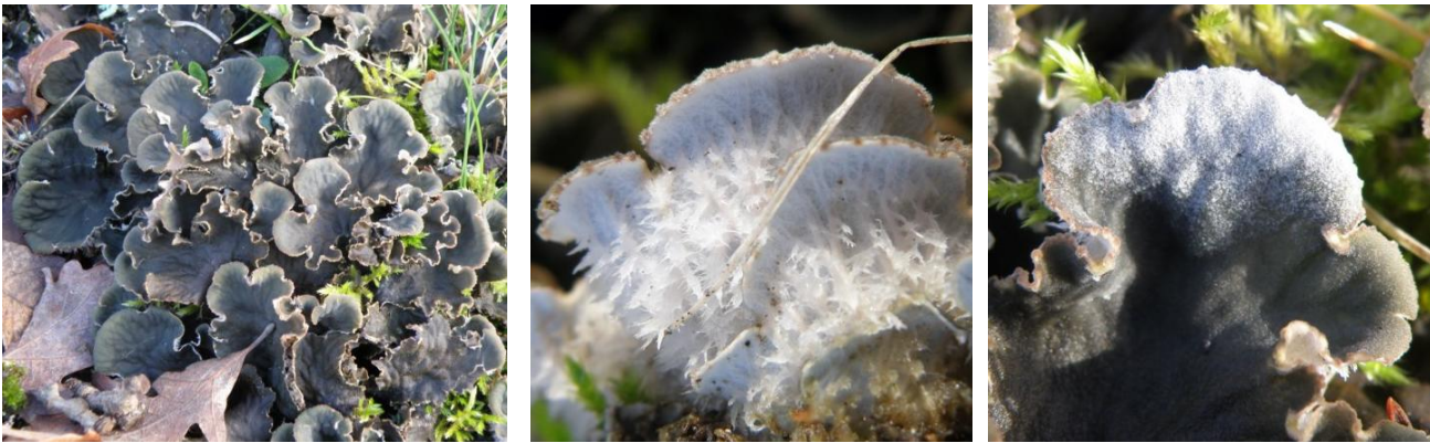
Peltigera canina (L.) Willd., Revel le 11/01/2013