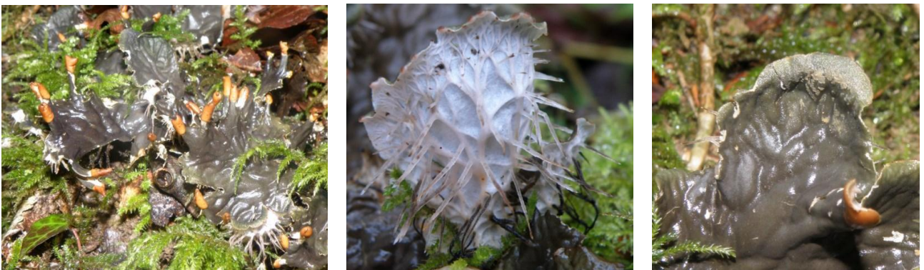
Peltigera membranacea (Ach.) Nyl., Arbas le 07/01/2013