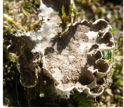
Peltigera didactyla (With.) J. R. Laundon, Melles le 24/07/2014 et Oô le 06/07/2014