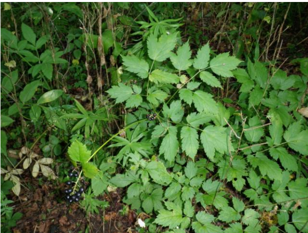
Actea spicata (M. TESSIER)