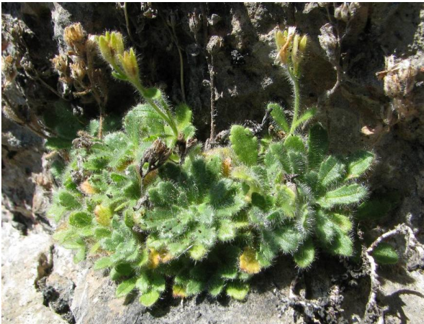
Erinus alpinus hirsutus (Nicolas GEORGES)