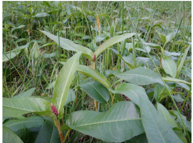
Polygonum amphibium et Alopecurus sp. (M. TESSIER)