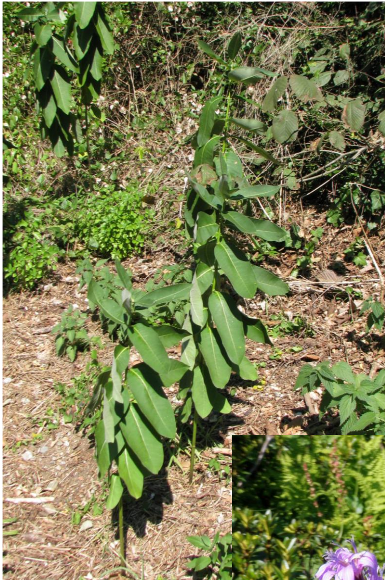
Asclepias syriaca (Nicolas GEORGES)