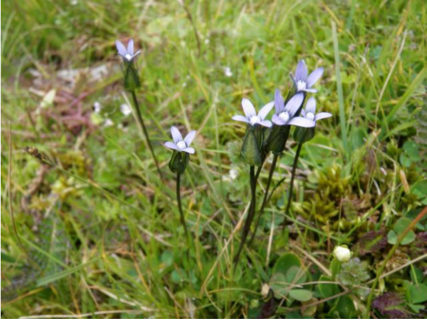
Gentianella tenella (M. TESSIER)