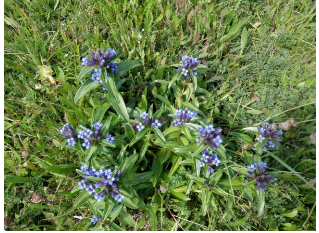
Gentiana cruciata (M. TESSIER)