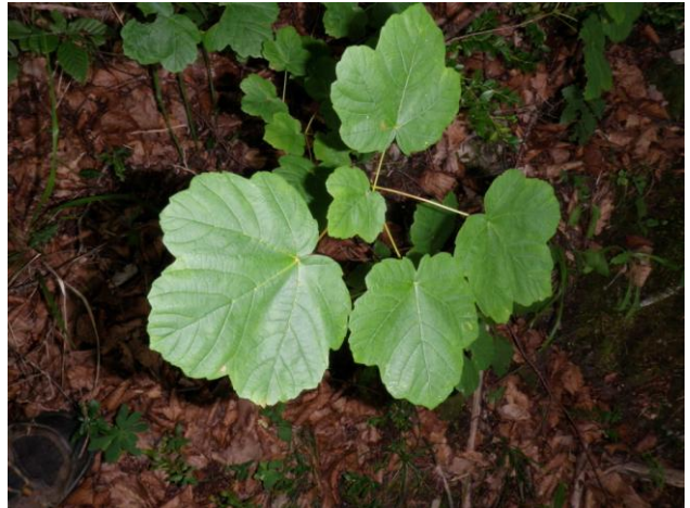
Acer opalus (M. TESSIER)