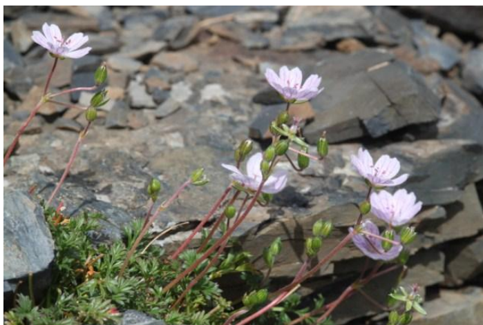
Erodium glandulosum (Cav.) Willd.