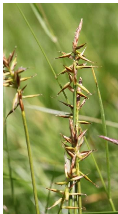
Carex macrostylon Lapeyr.