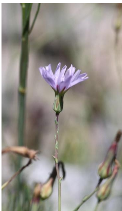
Lactuca tenerrima Pourr.