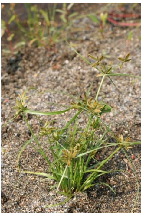
Pycreus flavescens (L.) Reichenb.