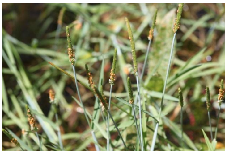
Alopecurus aequalis L.