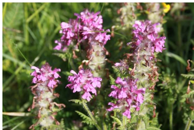
Pedicularis verticillata L.