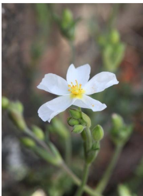
Halimium umbellatum (L.) Spach