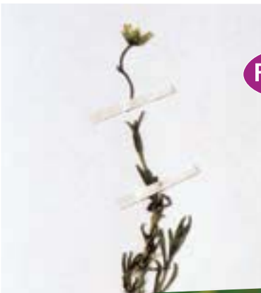
← Minuartie dressé , herbier de Genève (M. André)

Cette gracieuse petite plante des tourbières, qui ne se rencontrait que dans le massif jurassien en France, n'a plus été observée dans la région depuis 1958. Il semble qu'elle ait souffert de l'effet conjoint de la destruction de ses biotopes et des prélèvements des collectionneurs.