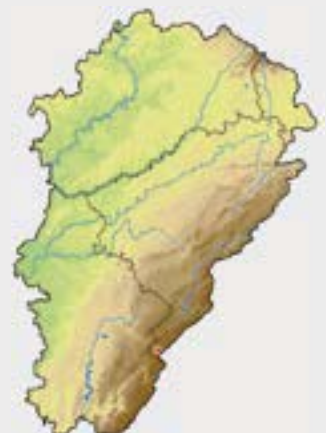
← Crépide rongée (F. Dehondt) Présence par commune (en rouge, après 2000, en bleu, avant) →

Cette plante présente une aire d'occupation très restreinte en Franche-Comté. Elle n'est connue que d'une unique population dont les quelques centaines d'individus dont elle est constituée, colonisent les flancs de trois petites dolines sur la commune de Chapelle-des-Bois. Les comptages réguliers montrent une fluctuation importante du nombre d'individus matures ayant la capacité de se multiplier (quelques dizaines à plus de trois cents). Ces données conduisent à considérer cette crépide comme en danger critique d'extinction (CR B2ac(iv)). Cette espèce bénéficie d'un plan de conservation et des mesures de gestions adaptées à sa biologie ont d'ores et déjà été mises en place en partenariat étroit avec le Parc naturel régional du Haut-Jura. Son avenir reste cependant précaire.