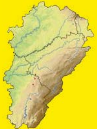
← Campanule cervicaire (E. Brugel) Présence par commune (en rouge, après 2000, en bleu, avant) ↑

Et pourtant les efforts des forestiers n'ont pas été inutiles : la banque de graines du sol a permis le retour de la plante dès que son biotope a été remis en lumière. Depuis, une nouvelle population a été redécouverte, mais l'avenir de l'espèce, aujourd'hui considérée comme vulnérable, ne repose que sur la pérennité du biotope qui abrite deux populations totalisant moins de 1 000 individus.