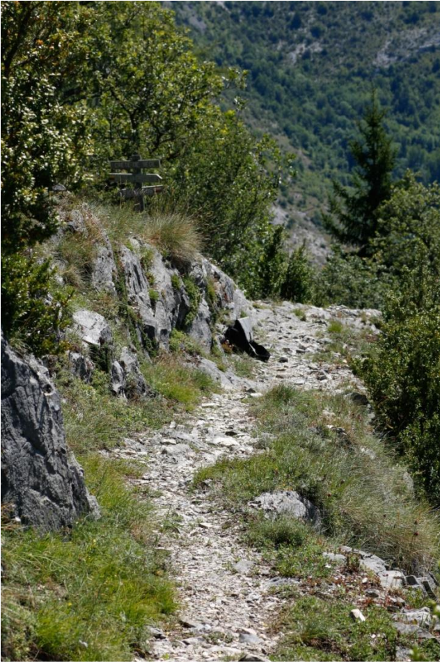
Vue d'ensemble du caillou à Erodium lucidum