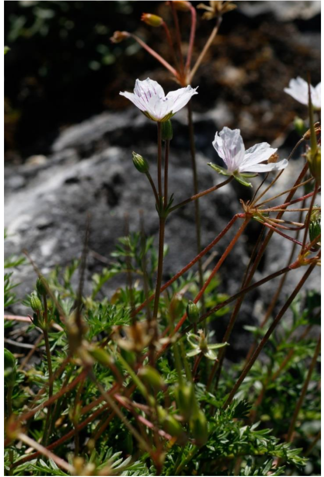
La plante dépasse à peine les 20 cm de haut mais on ne voit que ça !