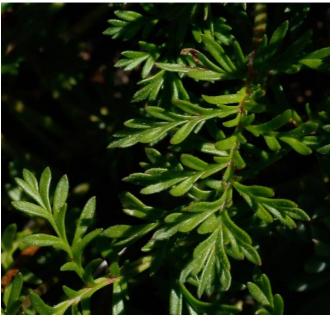
Le limbe est plus ou moins glabre et luisant (quelques poils épars sur la face supérieure)